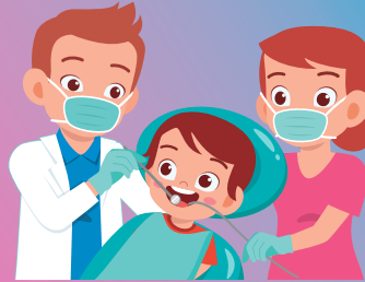
Visita al dentista