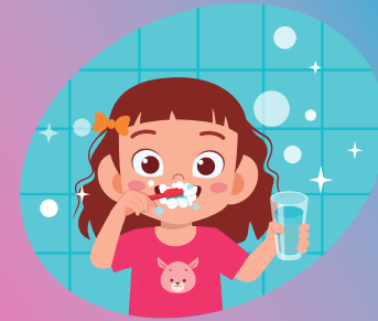
Lavado de dientes