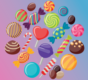
Causantes de caries